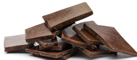
Roztopiona gorzka czekolada