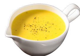
Sos z cytryny, oliwa, miód, soli i pieprzu