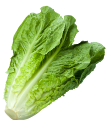
Liście sałaty rzymskiej