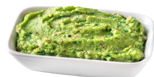
Sos z awokado (guacamole)